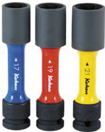
Färgade hjulmutterhylsor 1/2"